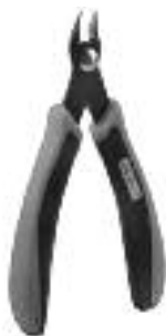
Art. Nr. 170688 Spezial-Seitenschneider

Vloeibare lijm in plastic-flacon met doserbuisje om nauwkeurig te lijmen.